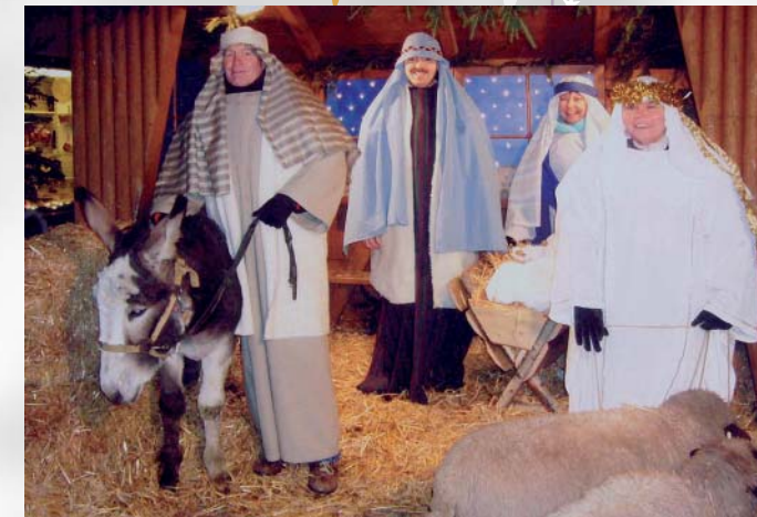
Lebende Krippe der Baptistengemeinde Cham